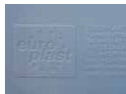
Reliefprägung Relief printing