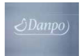
Heißprägung und Nummerierung Hot printing and numbering