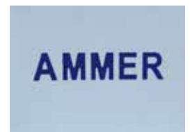
Heißprägung Hot printing

Contena-Ochsner AG Steinackerstrasse 31 8902 Urdorf