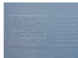
Reliefprägung Relief printing