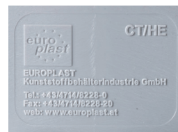
Reliefprägung Relief stamping