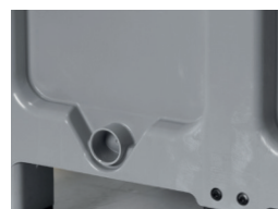
Abflussöffnung Drainage opening

REACH-konform, lebensmittelecht Reach-compliant, food safe